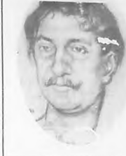
POR E. GOMEZ CARRILLO LOUIS-MICHAND.-PARIS.