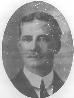
MR. WILLIAM E. GONZALEZ Nombrado Ministro de Norte América ante el gobierno cubano.