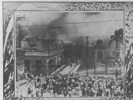
EL INCENDIO DE LA CASA HARRIS BROSCHE.—Vista en el momento en que el voraz elemento tomaba grandes proporciones. "Bohemia" envía a los propietarios del establecimiento incendiado el testimonio de su pena por las pérdidas sufridas, haciendo votos porque el anuncio de edificar el nuevo edificio de la importante firma Harris Brosch sea una pronta realidad.