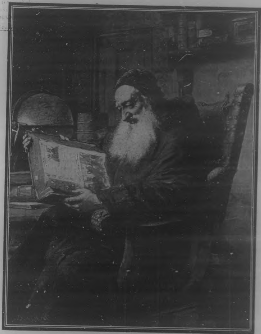
UN BIBLIOFILO, Cuadro de E. Grutzner.